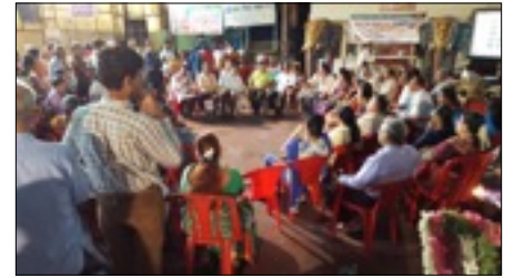
“ವಿಜಯಕರ್ನಾಟಕ”, ೨೬.೬.೨೦೧೭ ವರದಿ

ಗಾರಿಗೆ, ಗಟ್ಟಿ, ಪಾಯಸ, ಹಲ್ವ, ಬನ್ನೆ, ಸಿರಿಧಾನ್ಯಗಳ ಉಪ್ಪಿಟ್ಟು, ಕ್ಷೀರ, ಹಲ್ವ, ಮೊಸರನ್ನ, ಜೋಳದ ರೊಟ್ಟಿ, ಕೊರಲೆ ರೊಟ್ಟಿ, ಕೆಸುವಿನೆಲೆ ಪತ್ನೋಡೆ, ಕಡಲೆಬೇಳೆ ಚಟ್ಟಂಬಡೆ, ಮಣಸಿನ ಬಜ್ಜಿ ಇತ್ಯಾದಿ ತಿಂಡಿತಿನಿಸುಗಳ ಮಾರಾಟ ಜೋರಾಗಿತ್ತು. ಹಲವಾರು ತಿಂಡಿತಿನಿಸುಗಳನ್ನು ಸ್ಥಳದಲ್ಲಿಯೇ ತಯಾರಿಸಿ ಬಿಸಿಬಿಸಿಯಾಗಿ ಒದಗಿಸುತ್ತಿದ್ದದ್ದು ವಿಶೇಷ. ಸ್ಥಾಲುಗಳಿಗೆ ಭೇಟಿ ನೀಡುತ್ತಾ, ಸವಿಸವಿಯಾದ ತಿನಿಸುಗಳನ್ನು ಚಪ್ಪರಿಸುತ್ತಾ, ಮನೆಗೆ ಒಯ್ಯಲಿಕ್ಕಾಗಿಯೂ ಕಟ್ಟಿಸಿಕೊಳ್ಳುತ್ತಾ ಇದ್ದ ಜನರ ಋಷಿ ಅವರ ಹಾವಭಾವಗಳಲ್ಲಿಯೇ ಸ್ಪಷ್ಟವಾಗಿ ಕಾಣಿಸುತ್ತಿತ್ತು.