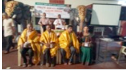
ಸಿರಿಧಾನ್ಯ ಬೆಳೆಗಾರರಿಗೆ ಸನ್ಮಾನ

ಸಾವಯವ ಕೃಷಿ ಉತ್ಪನ್ನಗಳು ಹಾಗೂ ಬಗೆಬಗೆಯ ತಿಂಡಿತಿನಿಸುಗಳು: ಅಲ್ಲಿ ಉತ್ಪಾದನೆಯಲ್ಲಿ ಸಾವಯವ ಪದ್ಧತಿಯಲ್ಲಿ ಬೆಳೆಸಿದ ಕರಿಮೆಣಸು, ನೆಲಬಸಳೆ, ಕೆಸುವಿನ ಎಲೆ, ತಜಂಕು ಸೊಪ್ಪು, ಅನಾನ್ಸ್, ಬಾಳೆಪೂಂಬೆ (ಹೂ), ಪಪ್ಪಾಯಿ, ಪೇರಳೆ, ಸೌತೆಕಾಯಿ, ಗೆಣಸು ಇತ್ಯಾದಿ ತರಕಾರಿಗಳು, ರಾಗಿ,