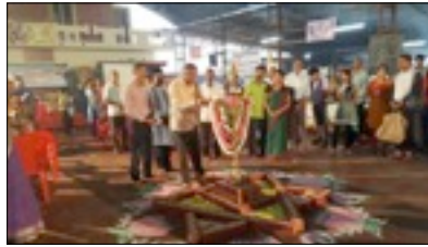
ಸಿರಿಧಾನ್ಯ ಮೇಳ ಉದ್ಘಾಟನೆ

ಜೂನ್ ೨೫ರ ಭಾನುವಾರ ಒಂದೆಡೆ ಧಾರಾಕಾರವಾಗಿ ಸುರಿಯುತ್ತಿದ್ದ ಮಳೆ, ಇನ್ನೊಂದೆಡೆ ಬೆಳ್ಳಂಬೆಳಗ್ಗೆ